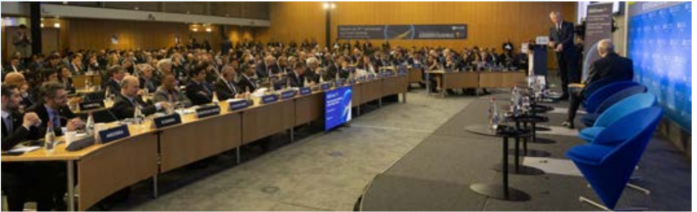
Reunión conmemorativa del 10º aniversario del Foro Global celebrada en noviembre de 2019, con motivo de la presentación del módulo IFSF-IAI.

Todo programa IFSF-IAI suele incluir diversas misiones para la prestación de asistencia periódica in situ , de una a dos semanas de duración cada una, conformadas por varias visitas repartidas en intervalos regulares durante un período de 18 a 24 meses y complementadas con la modalidad de asistencia a distancia.