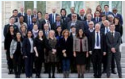
Table ronde d'experts IISF et Atelier de consultation des parties prenantes, février 2019

Cette manifestation parallèle a donné la possibilité d'en apprendre davantage sur les défis complexes auxquels se heurtent un grand nombre de pays d'Afrique engagés dans la mobilisation de leurs ressources intérieures. Conformément aux ambitions que porte le Programme de développement durable à l'horizon 2030, les pays africains doivent mobiliser davantage de ressources pour assurer la transformation structurelle de leurs économies. L'ensemble des parties prenantes, y compris les États, les partenaires au développement, les institutions financières multilatérales et le secteur privé, pour ne citer que celles-là, ont toutes un rôle à jouer. Pendant cette manifestation, un groupe d'experts a examiné les expériences concluantes dans ce domaine ainsi que les voies suivies pour obtenir des résultats et les moyens par lesquels les pouvoirs publics pourraient effectivement faire réagir le secteur privé pour que les entreprises deviennent des « citoyens responsables » en Afrique.